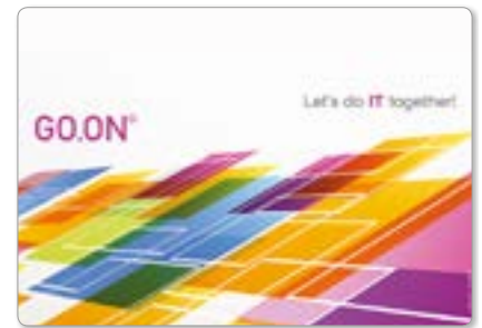
Ansicht des fertigen LapKoser®